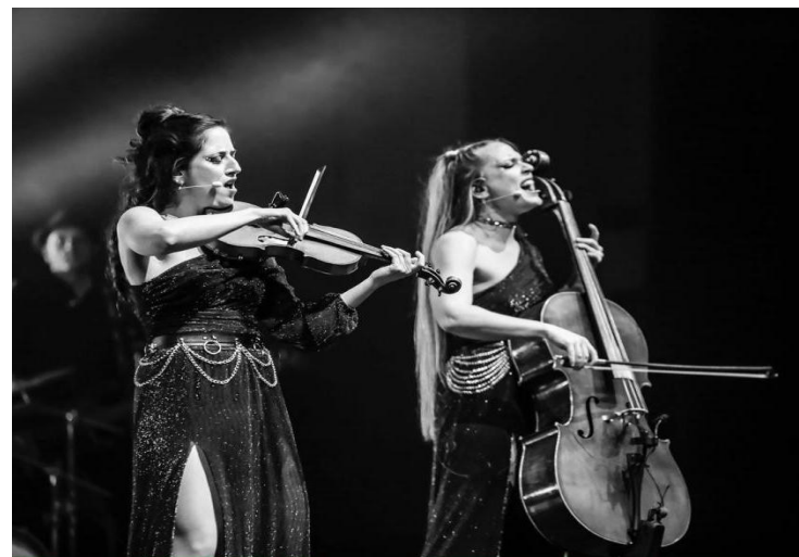
Premios Heraldo de Aragón, Zaragoza, noviembre del 2023.